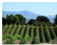
Tourisme & loisirs